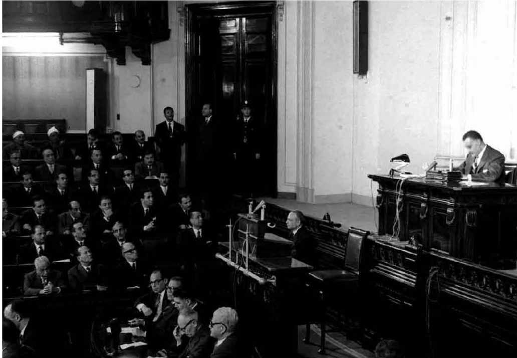
حديث عبد الناصر لاجراء اللجنة التحضيرية للمؤتمر الوطني ١٩٦١/١١/٢٥

الخدمات على قواعد اشتراكية.. المحاسبين الخدمات قاصرة على قلة. المحامين